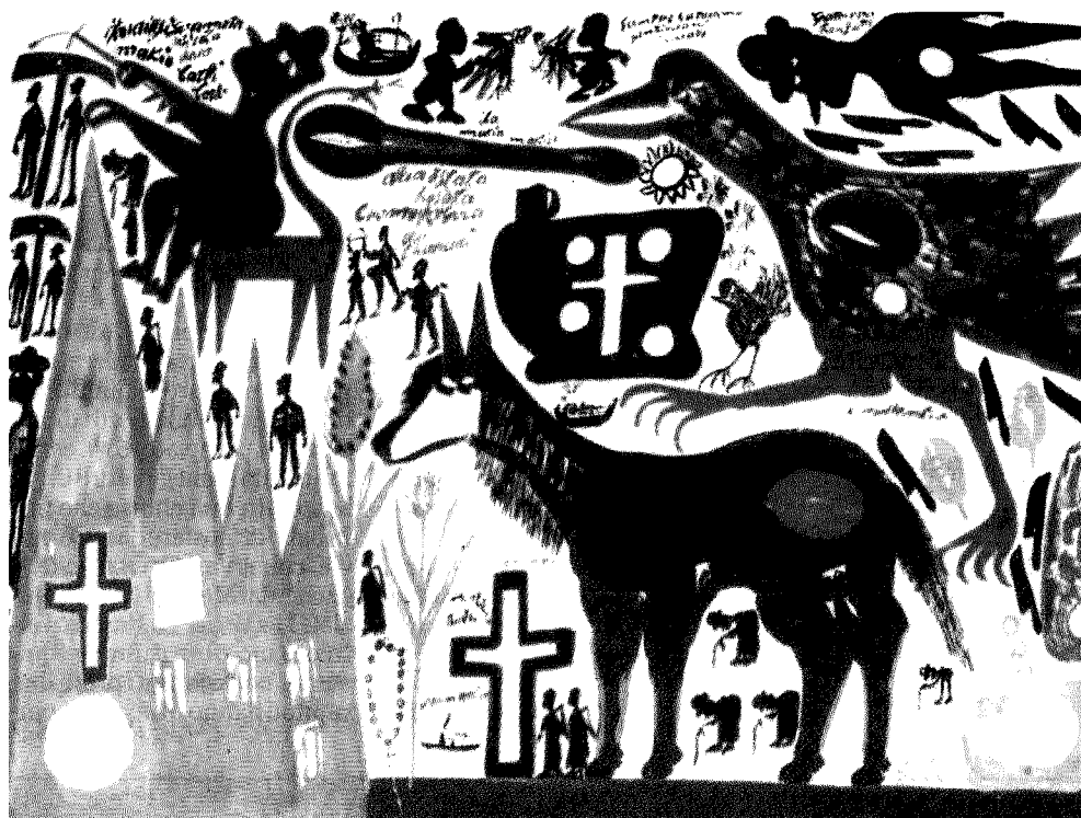
Un'opera di Carlo Zinelli, il veronese maestro dell'art brut, a cui il Museum of everithing dedica una mostra